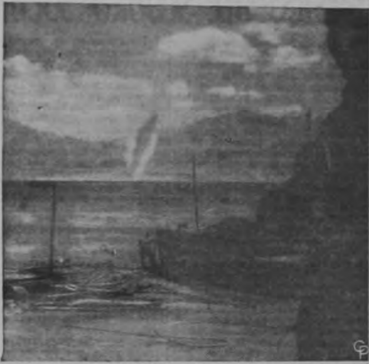
Muy ocupados en fomentar el puerto de Elath en el golfo de Akaba como salida al Mar Rojo, Israel ha notificado que considerará como "un acto de guerra" cualquier movimiento árabe para impedir su navegación en el canal de Suez o en el Golfo. El humo que se eleva al fondo procede de la demolición de depósitos de municiones británicas y fortificaciones en Jordania, que siguieron a la abrogación del tratado entre Inglaterra y Jordania.