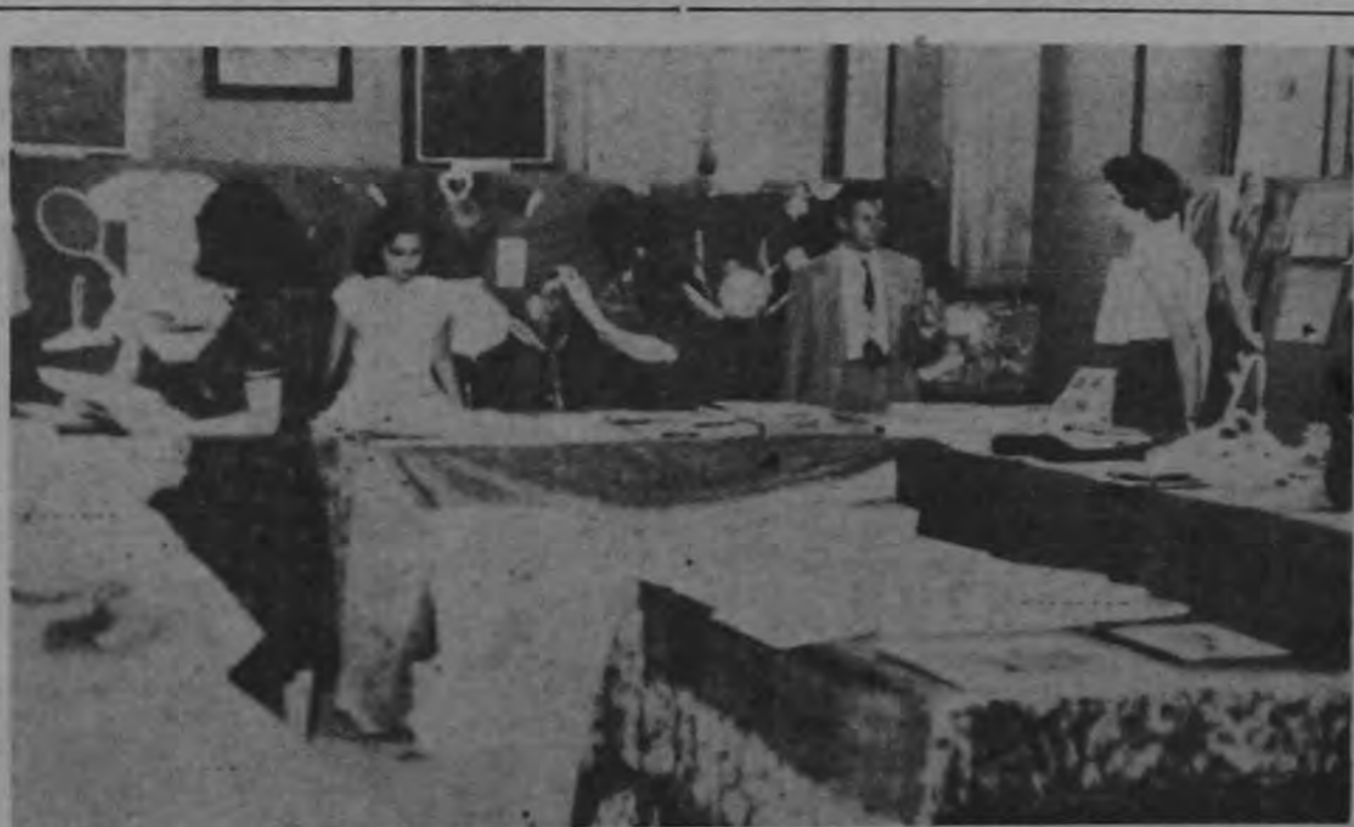
A las nueve de la mañana de ayer con gran éxito quedó abierta la exposición de los adjudicatarios de viviendas del INVU por parte de grupos de todas las ciudades. Además de algunas actividades de la institución así como otras entidades de mejoramiento social del país.

Indagando sobre el texto de la renuncia, se nos dijo que no está planteada con carácter de irrevocable dando pie para su reti-