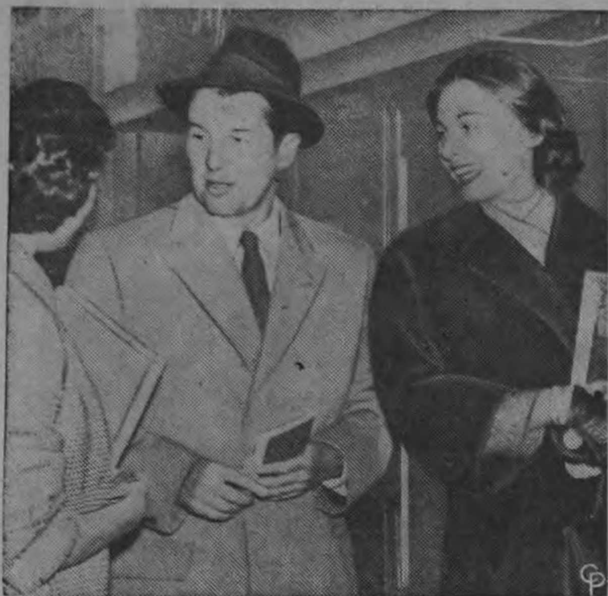
Alfred Gawayne Vanderbilt y su esposa Pean Harvey (derecha) charlan con un turista mientras hacen escala en París en viaje a Ginebra, Suiza. Allí, el millonario deportista norteamericano asistirá al Congreso de la Asociación Mundial de Veteranos, que él preside. La pareja se casó recientemente en México y voló a Europa en un viaje combinado de negocios y luna de miel.