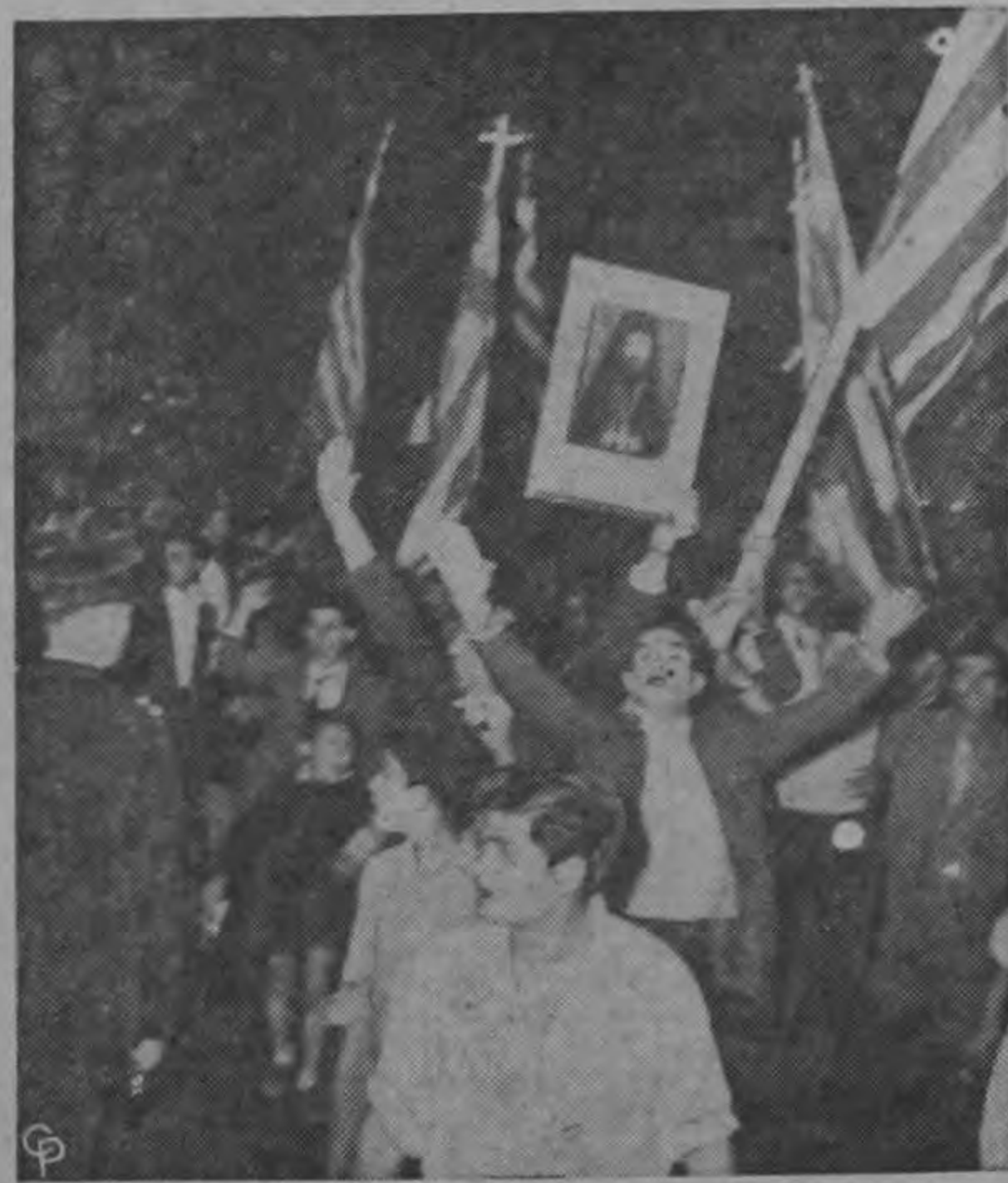
Chipriotes griegos portando un retrato del Arzobispo Makarios de Chipre, celebran a la vista de la policía en Nicosia después que los ingleses anunciaron la libertad del prelado. Makarios había estado detenido en Mahe, en las islas Seychelles. El Arzobispo dijo que no negociaría en nombre de los chipriotes griegos hasta que Inglaterra, que le ha libertado de su arresto, le permita regresar a Chipre.